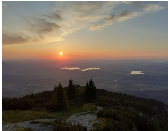
Sonnenuntergang am Heimgarten